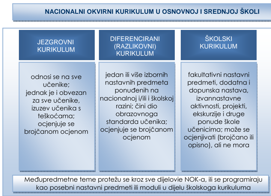
Slika 3. Struktura nacionalnoga kurikuluma u osnovnoj i srednjoj školi

Vodeći se znanstvenim istraživanjima, suvremenim obrazovnim pravcima te polazeći od odredaba Strategije za izradbu i razvoj nacionalnog kurikuluma za predškolski odgoj, opće obvezno i srednjoškolsko obrazovanje (2007.), Mjera za uvođenje obveznoga srednjega obrazovanja u RH (2007.) i čl. 27. Zakona o odgoju i obrazovanju u osnovnoj i srednjoj školi (2008.) Nacionalni okvirni kurikulum pretpostavlja kurikulumsku strukturu jednaku u osnovnoj i srednjoj školi. On se sastoji od jezgrovnoga, diferenciranoga ili razlikovnoga i školskoga kurikuluma (slika 3).